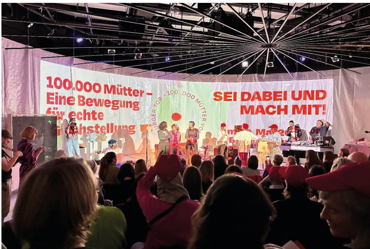
Vorstellung der Kampagne im Staatstheater Braunschweig beim Kombinat der Vulven am 18.12.2024

Ansprechpartner*innen für inhaltliche Fragen und Interviewanfragen: Mail: info@hunderttausendmuetter.de